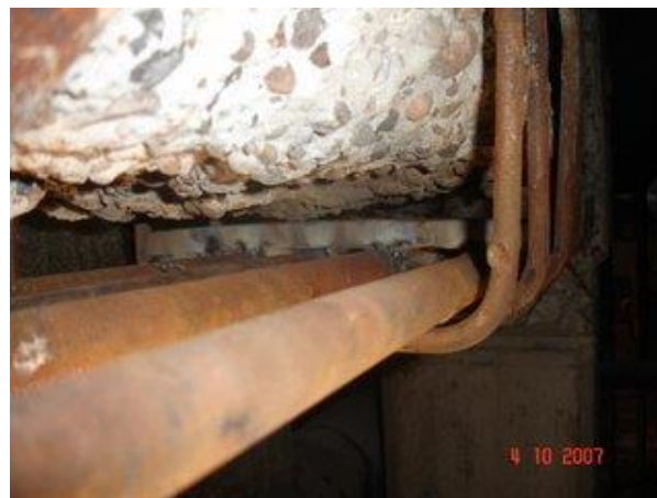
Figura 11. Platina soldada

Una vez seco el hormigón, se aplicó sobre la armadura, un revestimiento anticorrosivo como protector contra la corrosión de la armadura.