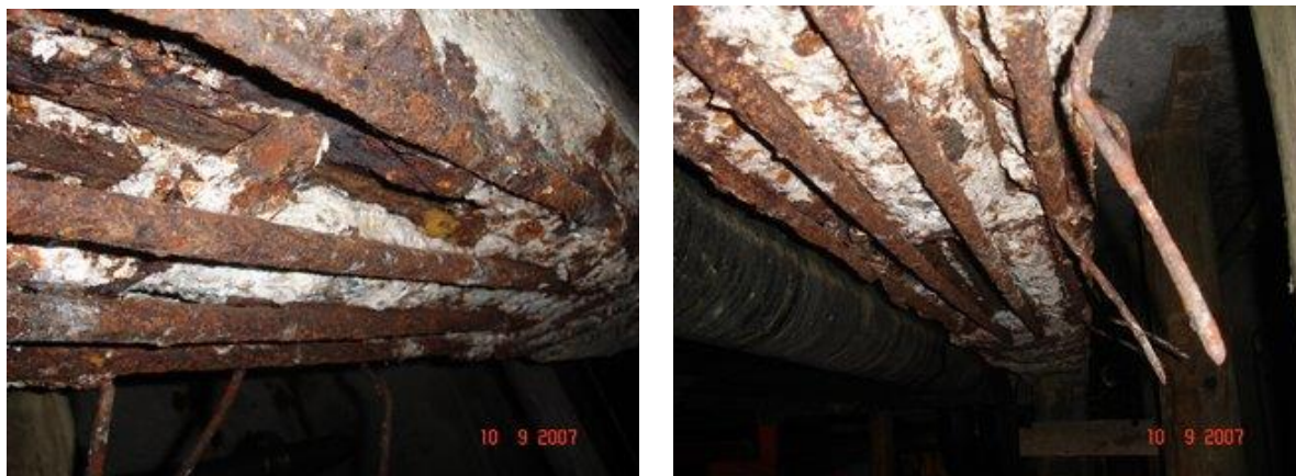
Figuras 5 y 6. Estado de la Viga N° 15 previo a su reparación

Se constatan grietas profundas en el hormigón como consecuencia de corrosión avanzada en armadura principal, faltantes de estribos en la zona central de la viga, y existencia de tramos de armadura principal utilizados como separadores transversales. (Figuras 5 y 6).