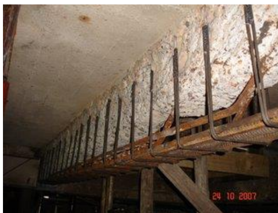
Figura 16. Viga N° 21 después de la reposición de armadura principal y estribos.

En el extremo A, pilar N° 30 (Figura 1), se practicaron perforaciones pasantes para introducir la nueva armadura evitando soldaduras, mientras que en el extremo B (Viga N° 2), se amuró la misma con anclajes químicos hasta 15 cm de profundidad.