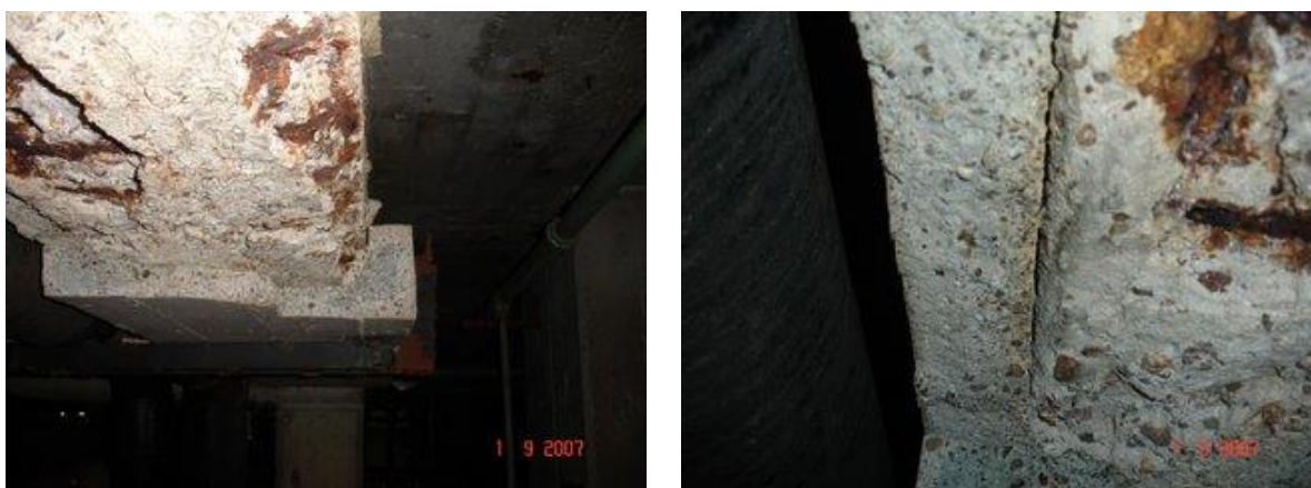
Figuras 4 y 5. Reparación anterior que evidencia la falta de intervención en las vigas afectadas

Reparaciones anteriores en forma de U de 0.08 m de espesor, en la zona inferior, con agrietamientos (Figuras 4 y 5).