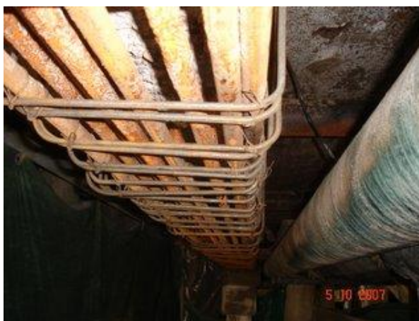
Figura 9. Reposición de estribos en viga N° 15

Se limpió toda la superficie resultante (hormigón y hierro) con un sistema de hidroarenado, y finalmente con agua a presión, con el objetivo de eliminar partículas sueltas y los productos de la corrosión acumulados sobre las varillas.