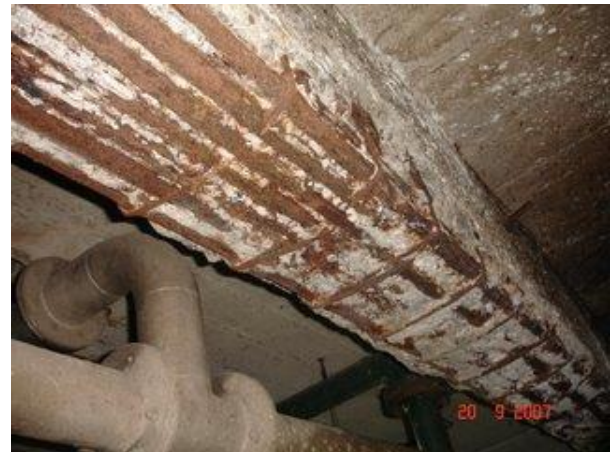
Figuras 13 y 14. Estado de la Viga N° 21 una vez eliminada la reparación anterior.