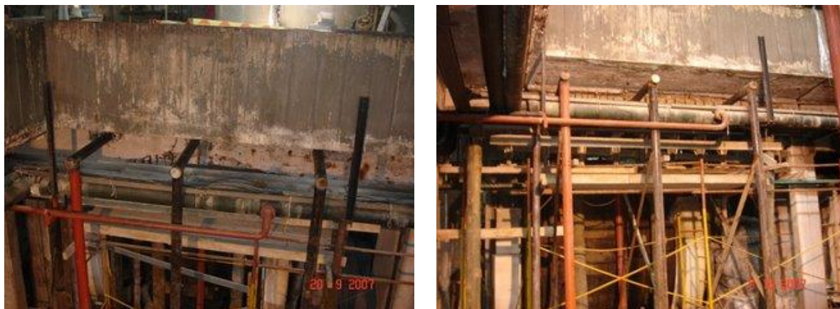
Figuras 7 y 8. Apuntalamiento de la viga N° 15

Previo al inicio de los trabajos, se apuntaló la losa contigua a la viga, hacia el interior del sector; ante la imposibilidad de apuntalar el voladizo por la existencia de cañerías instaladas cuyos fluídos alimentan la planta industrial en forma continua, y no se permitían desmontar, se apuntaló la viga por medio de 3 caños de hierro de \varnothing 5'' cédula 40, rellenos de hormigón, equidistantes, que la atraviesan y la sostienen con pilares de iguales características arriostrados entre sí a la mitad de su altura como mínimo. (Figuras 7 y 8)