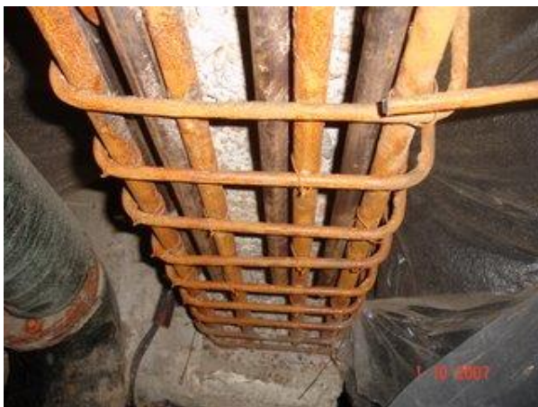
Figura 10. Extremo con estribos sanos

En uno de los extremos de la viga, donde los estribos y la armadura principal no habían sido afectados por la corrosión, se soldó una platina, y a ésta última la nueva armadura de refuerzo (Figura 11).