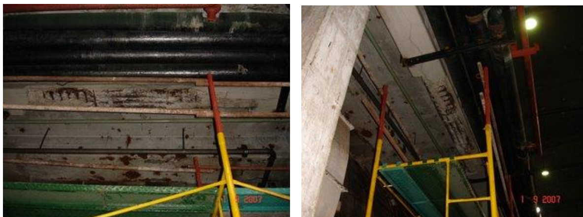
Figuras 2 y 3. Vistas inferiores del entrepiso

Reparaciones anteriores en forma de U de 0.08 m de espesor, en la zona inferior, con agrietamientos (Figuras 4 y 5).