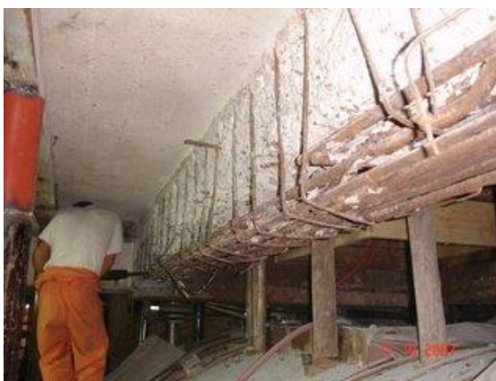
Figura 15. Eliminación mecánica del hormigón afectado en la viga N° 21