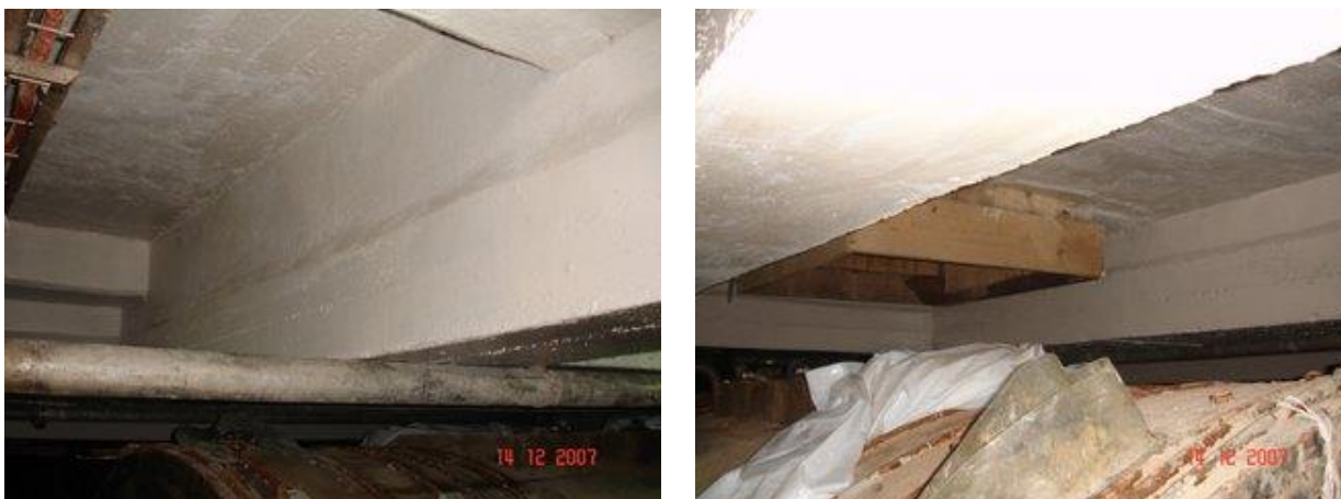
Figuras 19 y 20. Vigas N° 2, 18 y 21 luego de las reparaciones

En el resto de las vigas se realizó el mismo procedimiento que en la viga N° 21, sin el agregado de armadura principal.