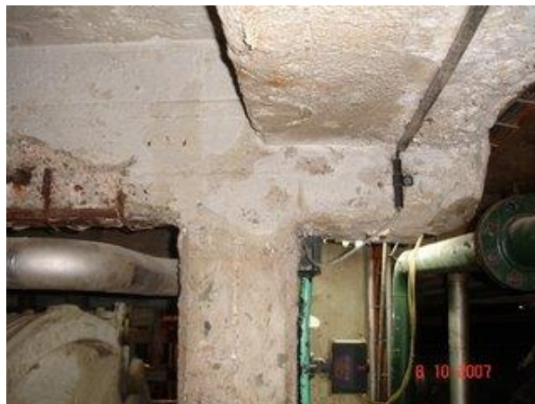
Figuras 17 y 18. Viga N° 21, Pilar N° 30 y Ménsula antes y después de la intervención

Una vez concluidos los trabajos en el resto de la estructura del fulón, se selló la superficie de hormigón expuesta, con 3 manos de pintura epóxica de alta resistencia a los agentes químicos, que ha dado buenos resultados a la fecha.